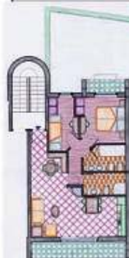
Villetta 6 posti letto monoplano