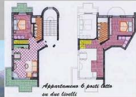
Appartamento 6, posti letto su due livelli

PREZZI A PARTIRE DA Euro 99.000,00 (con la formula del reddito garantito)