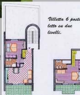
Villetta 6 posti letto su due livelli.