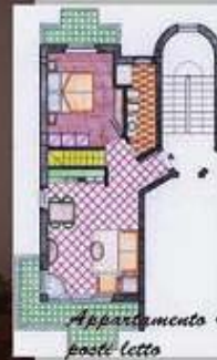
Appartamento 4 posti letto